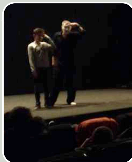
Dos dedos de frente

Las representación está financiada por Dirección de Salud Pública del Gobierno Vasco.