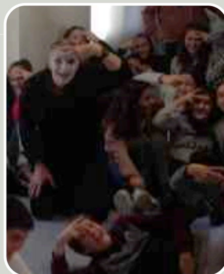
Dos dedos de frente

Las representación está financiada por Dirección de Salud Pública del Gobierno Vasco.