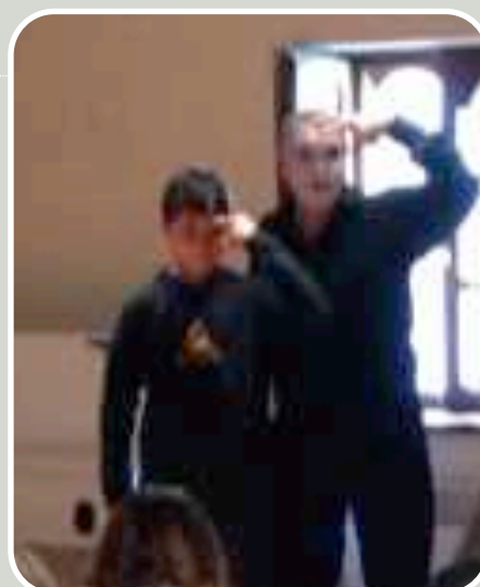
Dos dedos de frente

Las representación está financiada por Dirección de Salud Pública del Gobierno Vasco.